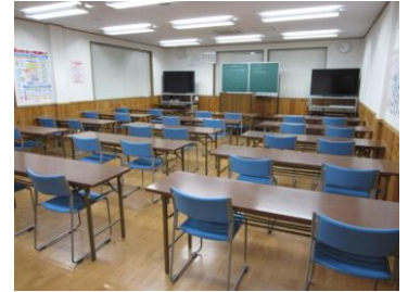
自動販売機、電子レンジ完備