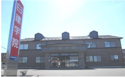
無料駐車場50台完備 コンビニ徒歩3分、イオン車で5分