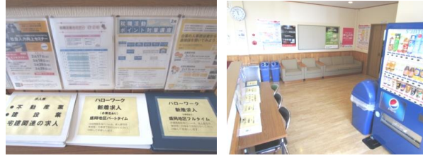
休憩ロビーに毎日更新の求人票を設置