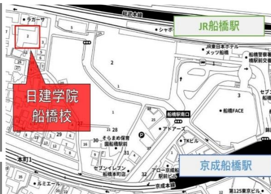
↑最寄駅から選考会場までの地図