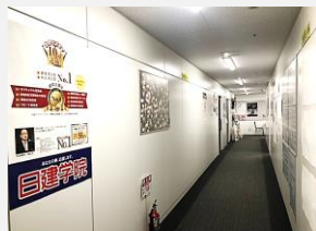
▲日建学院は様々な方がご来校します。施設はマナーを守ってご利用ください。