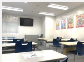
▲空気清浄機完備で学習環境も◎