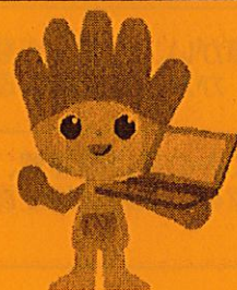
長野県ものづくり人材育成応援 キャラクター わざまる