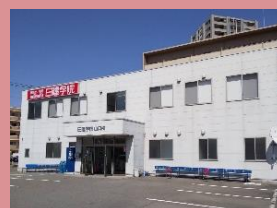
《 外観 》