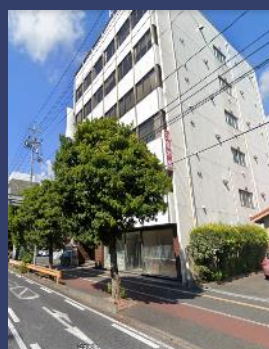
《 外 観 》