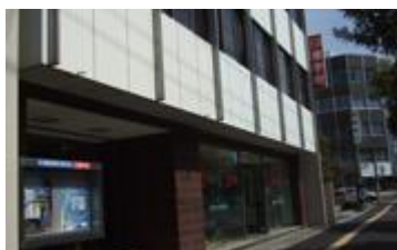
《 外 観 》