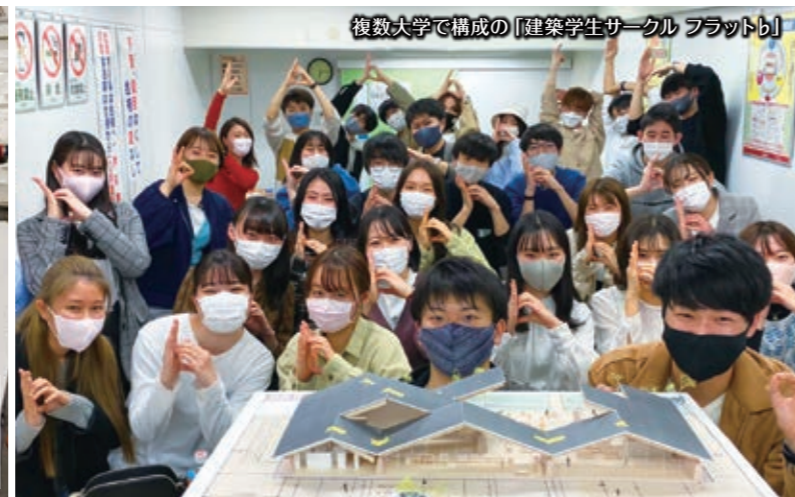
複数大学で構成の「建築学生サークル フラットb」