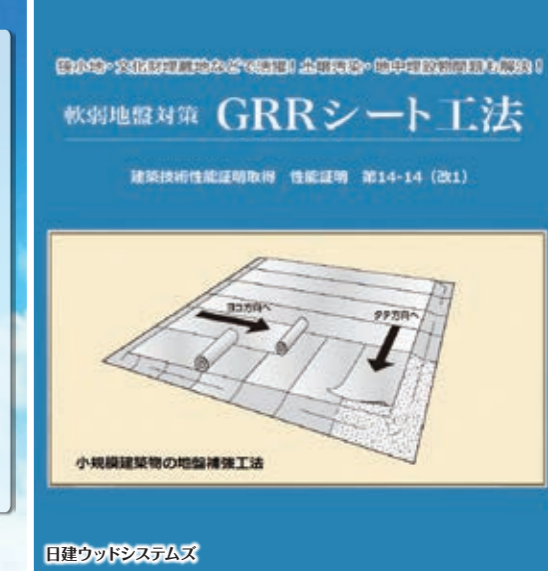
日建ウッドシステムズ