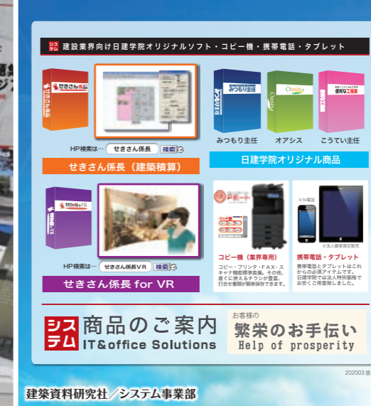
建築資料研究社/システム事業部