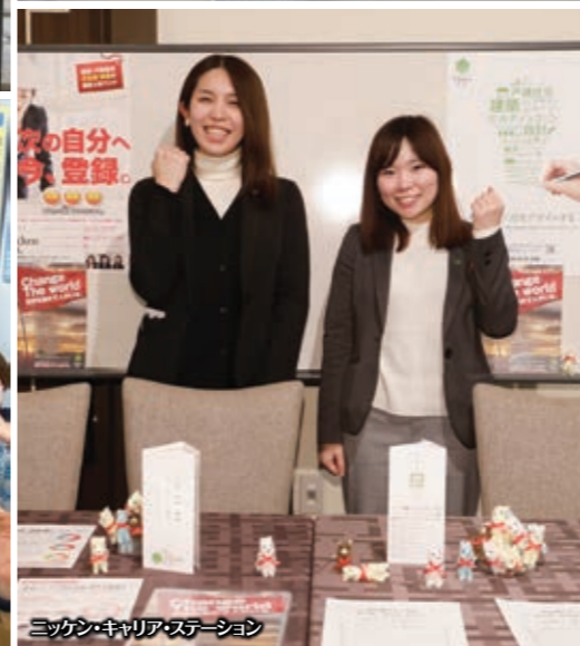
ニッケン・キャリア・ステーション