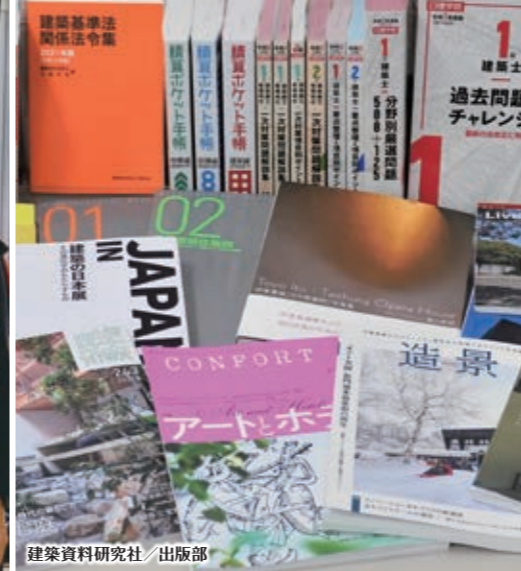
建築資料研究社/出版部