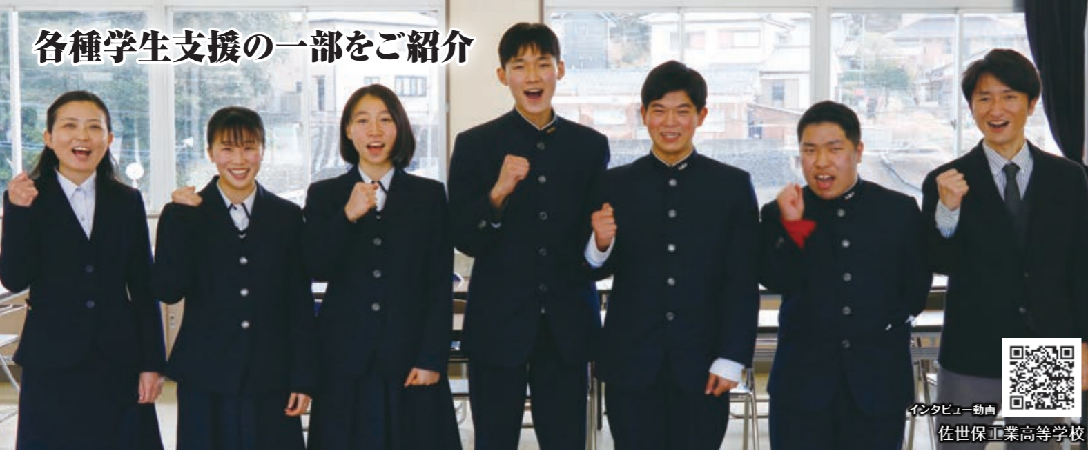
インタビュー動画 佐世保工業高等学校