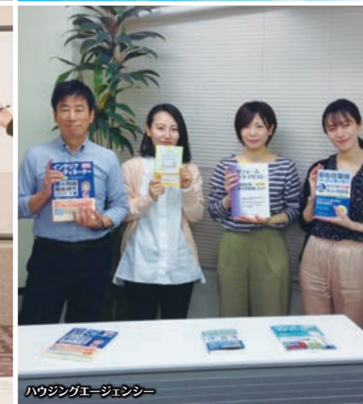
ハウジングエージェンシー